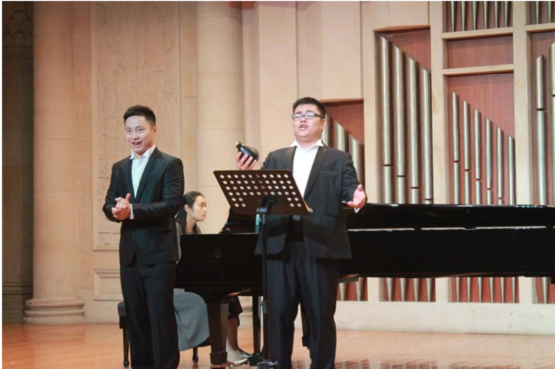
二重唱《爱的甘醇，一喝就灵》