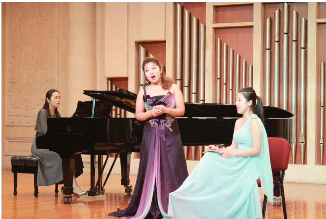
二重唱《微风轻轻吹拂的时光》